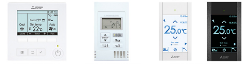
PAR-41 MAA PAC-YT52CRA PAC-CT01SB/PB

Filaires avec MAC-497IF-E ou MAC-334IF-E obligatoire