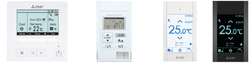
PAR-41 MAA PAC-YT52CRA PAC-CT01SB/PB

Filaires avec MAC-497IF-E ou MAC-334IF-E obligatoire