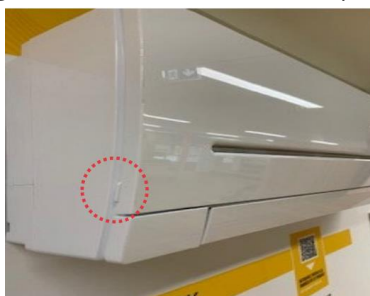
Photo de la butée