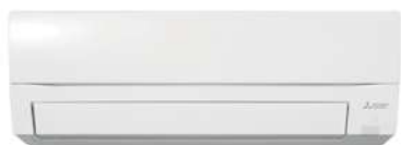
MSZ-FT 25/35/50 VGK

RETROUVEZ TOUTES LES DONNÉES DE CE PRODUIT EN SCANNANT CE QR CODE