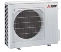
MUZ-FT 35 / 50 VGKZ