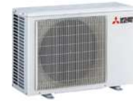
MUZ-FT 25 VGKZ