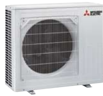
SUZ-M 50 VA