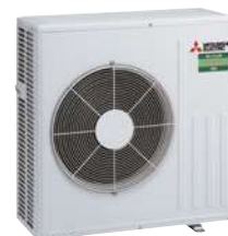
SUZ-M 60/71 VA