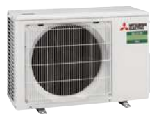
SUZ-M 25/35 VA