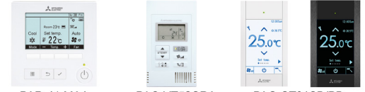
PAR-41 MAA PAC-YT52CRA PAC-CT01SB/PB

Câble de communication : télécommande ► Unité intérieure 2 x 0.69 mm 2 - 12 m linéaires fournis - 12 Volts CC