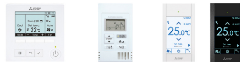
PAR-41 MAA PAC-YT52CRA PAC-CT01SB/PB

Câble de communication : télécommande ► Unité intérieure 2 x 0.69 mm 2 - 12 m linéaires fournis - 12 Volts CC