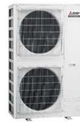
PUMY-P 250/300 YBM