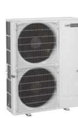
PUMY P 200 YKM2