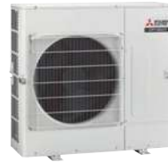
PUMY-SP 112/125/140 V(Y)KM2