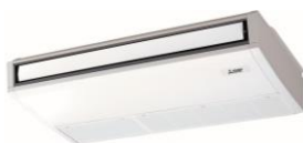
PCA-M *** KA2