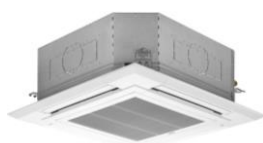
PLA-M *** EA2(1)