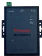
BACNET PROCON MELCO BEMS

Les interfaces groupées en KNX / MODBUS et BACnet sont à raccorder en IP sur chaque commande centralisée via un switch. Il est possible de communiquer jusqu'à 100 unités intérieures selon les passerelles. Il est possible de se connecter en TCP/IP - RTU/RS485 ou alors MS-TP selon les passerelles. Les différentes fonctions permettent une gestion du confort ainsi que d'acquies différentes informations de nos unités dans un soucis de confort.