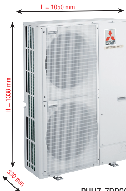
PUAH-ZRP200YKA Unité extérieure (UE)