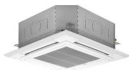
PLA-M *** EA2 (1)